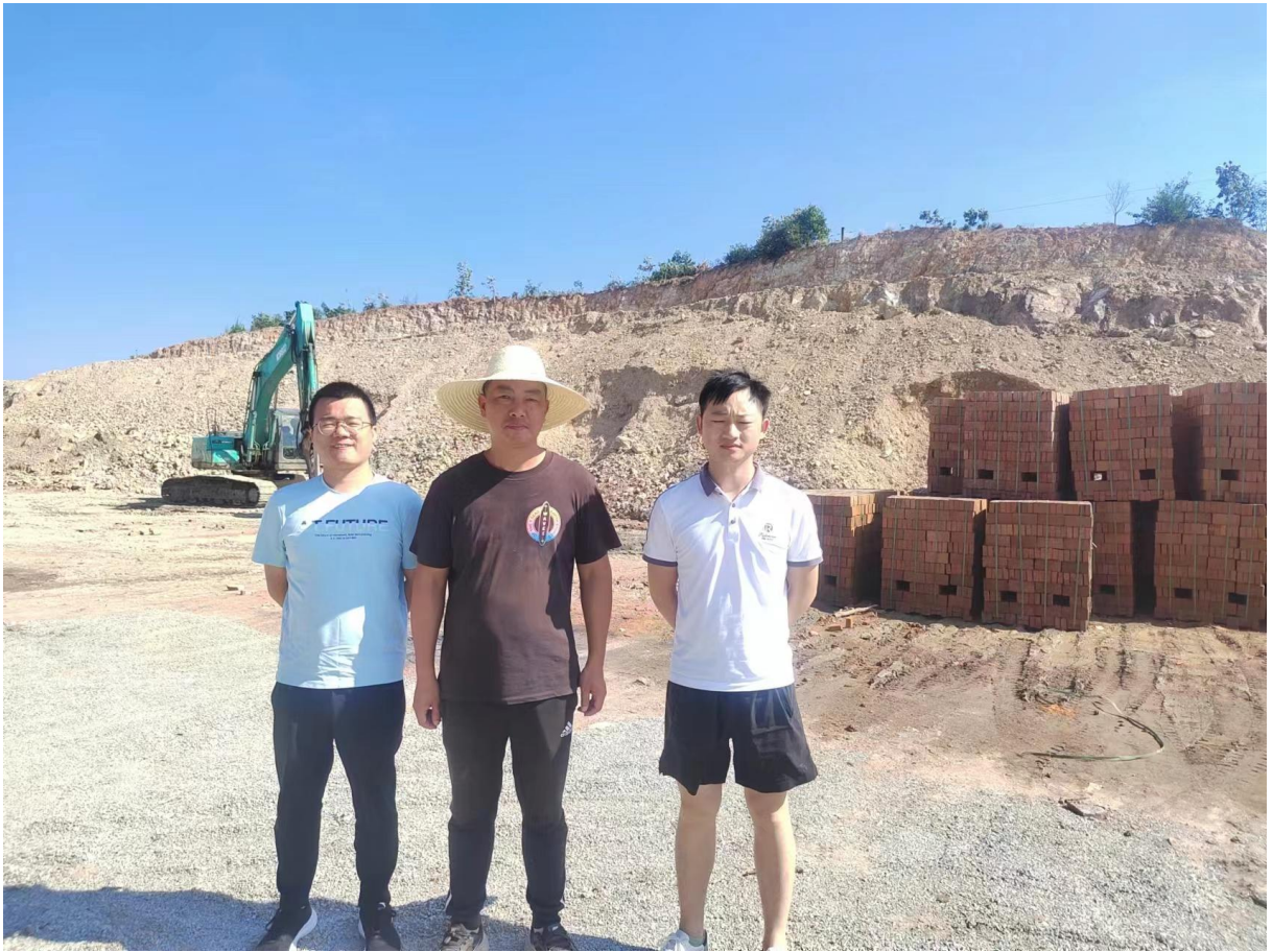
评价人员与企业人员现场合影