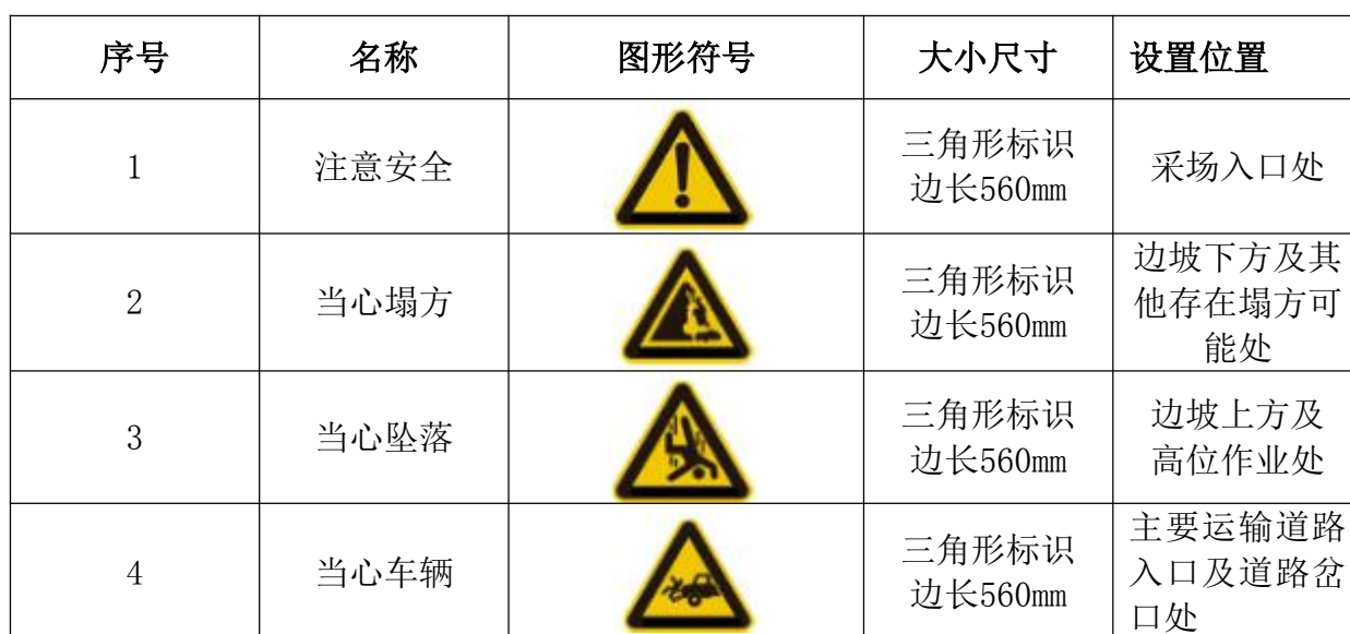
表 3-8 矿山安全标志表