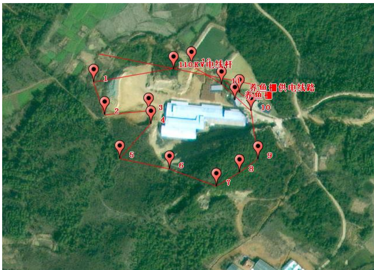
图 2-2：周边环境示意图

除上述外，采场周边 300m 范围内无医院、学校、大型水库及相邻矿山，500m 范围内无高压电线，1000m 可视范围内无铁路、国道等重要建筑及公共设施。